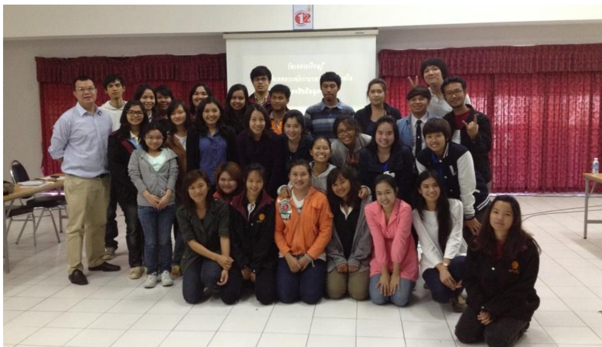
รูปภาพการอบรมหลักการปฏิบัติตนในชั้นศาลความรู้พื้นฐานเกี่ยวกับกระบวนการ ยุติธรรมในชั้นศาลและหลักการกรอกแบบสำรวจข้อมูล วันที่ 22 ธันวาคม 2555 ณ มหาวิทยาลัยแม่ฟ้าหลวง