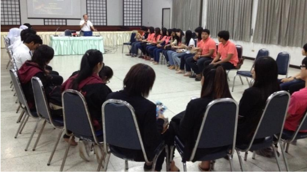
รูปภาพการจัดกระบวนการแลกเปลี่ยนเรียนรู้ประสบการณ์การสังเกตการณ์คดี วันที่ 26 พฤษภาคม 2556 ณ วีเทรน อินเทอร์เน็ตเซ็นเตอร์ กรุงเทพฯ