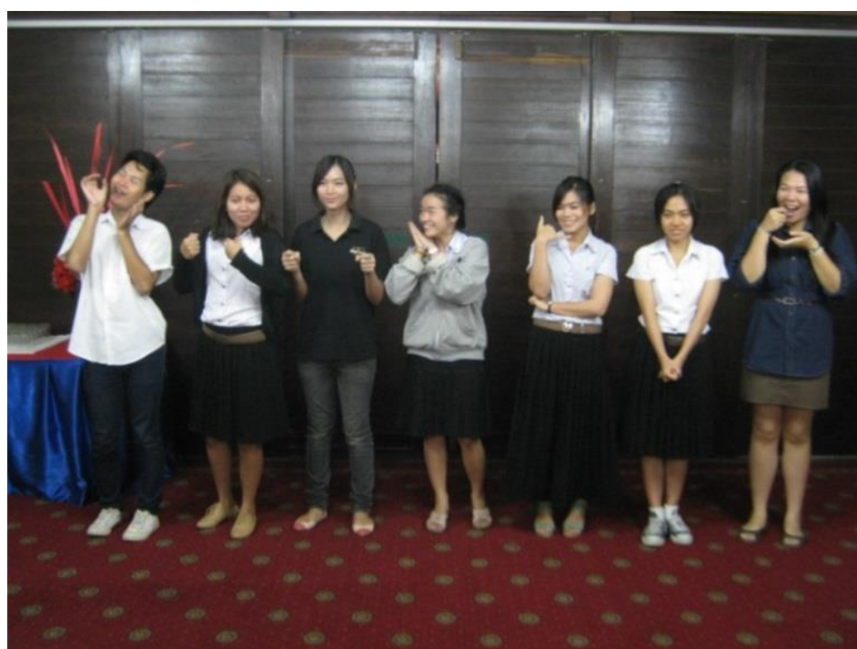
รูปภาพการอบรมหลักการปฏิบัติตนในชั้นศาลความรู้พื้นฐานเกี่ยวกับกระบวนการ ยุติธรรมในชั้นศาล และหลักการกรอกแบบสำรวจข้อมูล วันที่ 15 ธันวาคม 2555 ณ โรงแรมศิรินาถ การ์เดนส์ จังหวัดเชียงใหม่