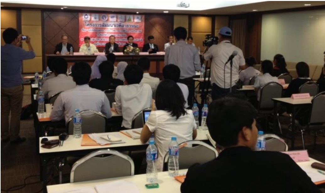
รูปภาพการสัมมนาเวทีสาธารณะเรื่อง “คดีสิทธิมนุษยชน กรณีการพิจารณา คดีด้วยความเป็นธรรม” วันจันทร์ที่ 27 พฤษภาคม พ.ศ.2556 ณ สำนักงานคณะกรรมการสิทธิมนุษยชนแห่งชาติ