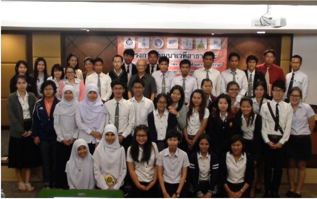
ภาพตัวแทนนักศึกษาเข้าร่วมนำเสนอผลงานในการสัมมนาเวทีสาธารณะเรื่อง “คดีสิทธิมนุษยชน กรณีการพิจารณาคดีด้วยความเป็นธรรม” วันจันทร์ที่ 27 พฤษภาคม พ.ศ.2556 ณ สำนักงานคณะกรรมการสิทธิมนุษยชนแห่งชาติ