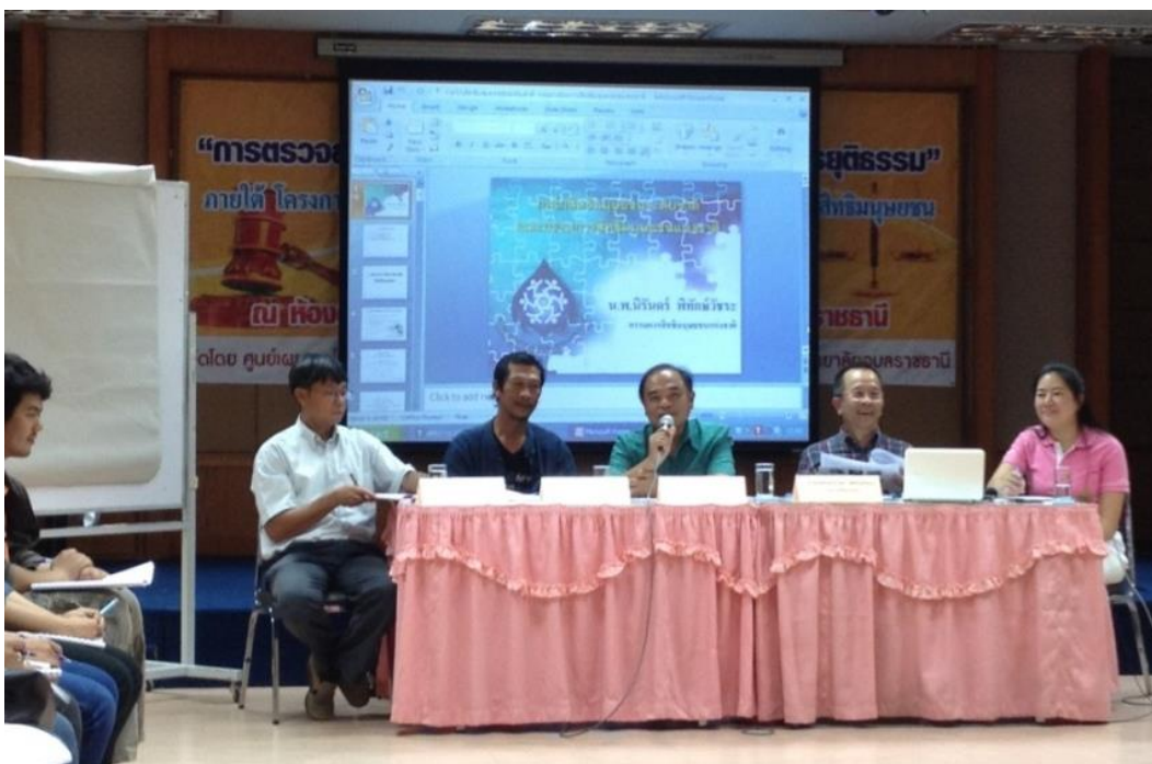
รูปภาพการอบรมหลักการปฏิบัติตนในชั้นศาลความรู้พื้นฐานเกี่ยวกับกระบวนการยุติธรรมในชั้นศาลและหลักการกรอกแบบสำรวจข้อมูล วันที่ 8-9 ธันวาคม 2555 ณ มหาวิทยาลัยอุบลราชธานี