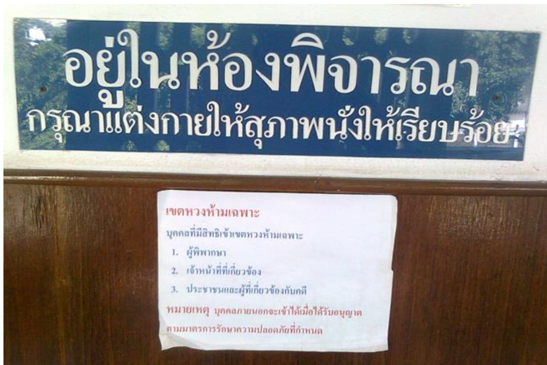
รูปภาพ ตัวอย่างป้ายกระดาษหน้าห้องพิจารณา

การที่มีป้ายกระดาษขนาด A4 ปิดประกาศไว้หน้าห้องพิจารณาโดยมีข้อความว่า “ห้ามมิให้บุคคลผู้ไม่มีส่วนเกี่ยวข้องขอเข้า” หรือ “ห้ามบุคคลภายนอกที่ไม่ได้รับอนุญาตเข้า” หรือ “ที่หวงห้ามเฉพาะบุคคลที่ได้รับอนุญาต” ทำให้ผู้สังเกตการณ์ทุกคนตั้งข้อสังเกตว่า ตนเองจะสามารถเข้าไปฟังการพิจารณาคดีในห้องพิจารณาคดีที่ติดประกาศป้ายดังกล่าวได้หรือไม่ ทั้งที่ทราบว่า การพิจารณาคดีต้องเป็นไปโดยเปิดเผยก็ตาม ซึ่งเป็นที่น่าสังเกตว่า แม้กระทั่งนักศึกษากฎหมายที่มีความรู้ด้านกฎหมายในระดับหนึ่งแล้วนั้น ยังต้องพิจารณาว่าตนสามารถเข้าไปในห้องพิจารณาคดีที่มีป้ายดังกล่าวติดไว้ได้หรือไม่ หากเป็นประชาชน ชาวบ้านที่เป็นญาติหรือผู้มีส่วนเกี่ยวข้องกับคดี เมื่อเห็นป้ายดังกล่าวอาจทำให้เกิดการเข้าใจผิดว่าตนไม่สามารถเข้าฟังการพิจารณาคดีได้ จึงไม่เข้าห้องพิจารณาคดี การติดประกาศป้ายที่มีข้อความไม่ให้ผู้มีส่วนเกี่ยวข้องเข้าร่วม